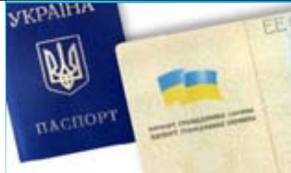
Пам'ятка старшокласникам стор. 4