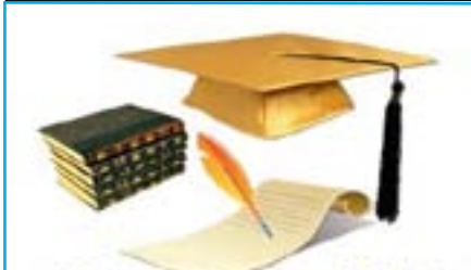
Ними пишеться школа стор. 3

ГАЗЕТУ ЗАСНОВАНО У 2013 РОЦІ ДРУКОВАНИЙ ОРГАН ДИТЯЧОЇ ОРГАНІЗАЦІЇ «ЮВЕНГО» КЗ «ХЗОШ» №30