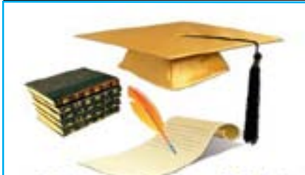
Ними пишається школа стор. 3

ГАЗЕТУ ЗАСНОВАНО У 2013 РОЦІ ДРУКОВАНИЙ ОРГАН ДИТЯЧОЇ ОРГАНІЗАЦІЇ «ЮВЕНГО» КЗ «ХЗОШ» №30